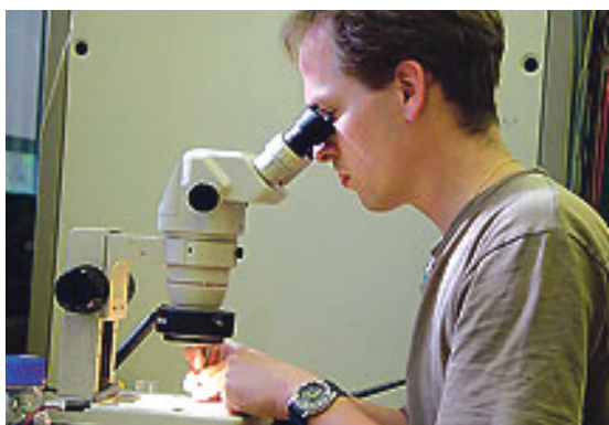
Slika 1a). 2003.–2004. Lausanne, Laboratorij Lászla Forra.

Nakon završenog studija proveo sam godinu dana na odsluženju vojnog roka, koji mi je ostao u razmjerno dragom sjećanju. Tu sam godinu iskoristio i kako bih odlučio kamo dalje. Otac i brat također su fizičari pa bi bilo nepraktično da sam ostao pripremati doktorat u Zagrebu. Kao i moja nešto mlađa sestra (također fizičarka), znao sam da trebam spakirati kofere i dokazati se prvo na internacionalnoj sceni, prije nego što mogu pomisliti vratiti se kući. Lomio sam se između nekoliko opcija i na kraju sam svoj put nastavio na École Polytechnique Fédérale de Lausanne (EPFL) u Švicarskoj (slika 1). I taj je odabir bio pun pogodak. Imao sam sreću raditi s prof. Lászlóm Forró [3], tada mentorom, a kasnije dragim prijateljem.